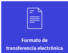
Formato de transferencia electrónica

a) Formato de transferencia electrónica: completamente requisitado con fecha y firma (sin espacios en blanco), es importante que la dirección fiscal que registres en la solicitud, coincida con el de tu constancia de RFC actualizada; es necesario que menciones el @ correo personal del titular de la carta autorización